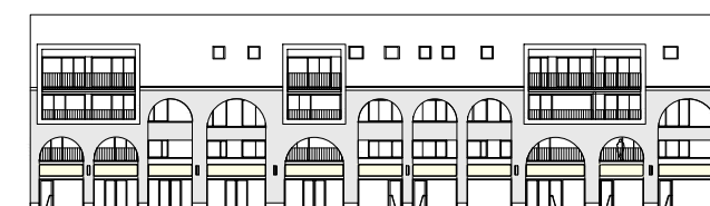
Straatgevel Oude vest