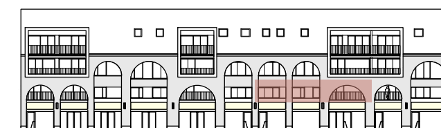
Straatgevel Oude vest